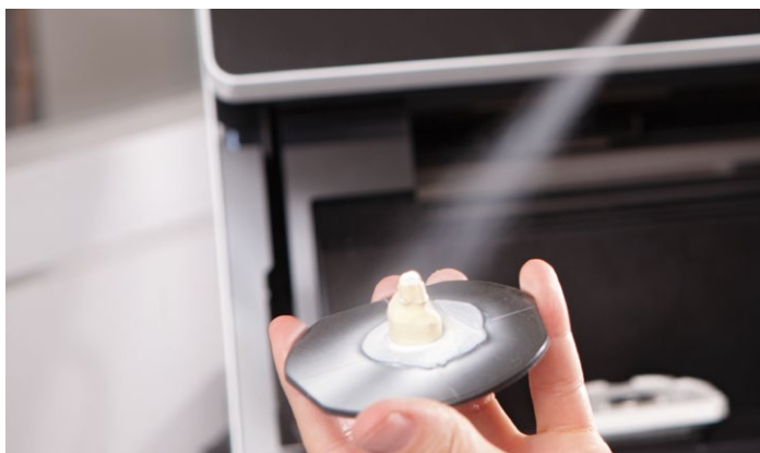
Applicazione di uno strato omogeneo per dettagliati risultati di scansione