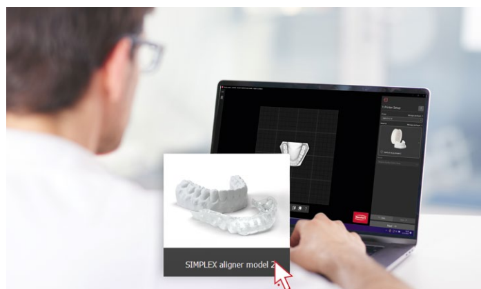
Прямая передача данных по сети LAN.