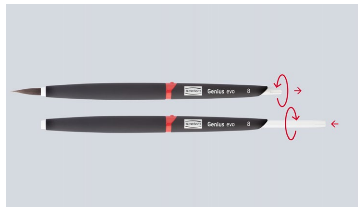
Integrierte Schutzfunktion durch Drehmechanismus