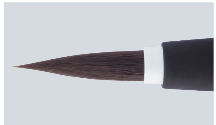
Der Klassiker unter den Keramikpinseln mit Bionic Hair